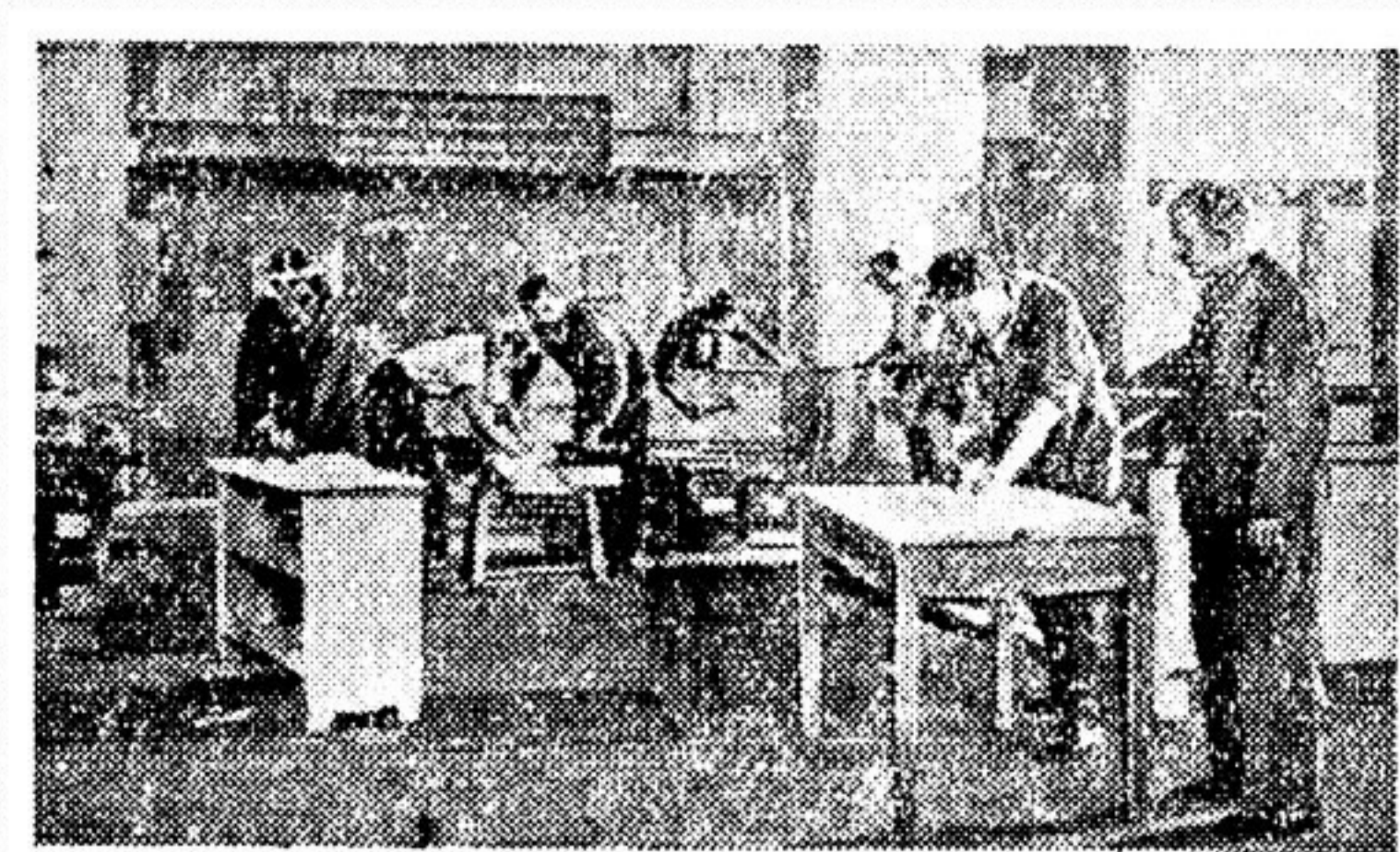
НА СНИМКАХ: слева — фото замка Кеннигштейн и репродукция текста статьи, напечатанной западногерманским журналом «Бадше иллюстрирте»; справа — фото одной из мастерских интерната, помещенное прогрессивным немецким журналом «Нейе берлинер иллюстрирте».