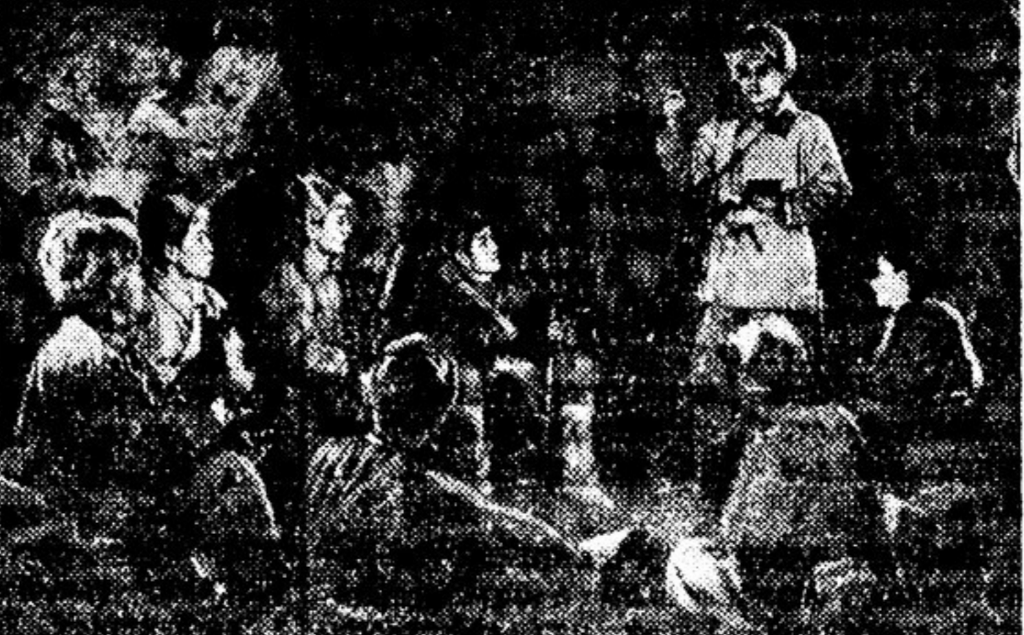
Кадр из фильма «Юные партизаны»

Кадр из фильма «Юные партизаны»... Маджик видит народный праздник. Он видит походы и танцующих пшомеров. Все испытанное им счастье встает перед ним, вливая новые силы для борьбы, для сопротивления захватчикам.